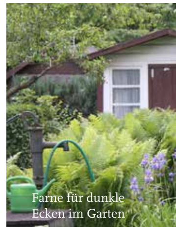
Farne für dunkle Ecken im Garten

Gartenvögel, Eichhörnchen und Igel sind an warmen und trockenen Tagen besonders durstig. Mit flachen Trinkschalen wie Keramikuntersetzern oder Suppentellern kann man ihnen schnell und einfach eine Tränke schaffen. Der ideale Platz ist ein gut einsehbarer Ort, damit sich Katzen nicht anschleichen können. Wichtig ist außerdem, das Gefäß regelmäßig zu reinigen und neu zu befüllen. Auch Bienen und andere Insekten brauchen Wasser zum Überleben. Wenn man die Tränke mit Steinen, Korken oder kleinen Zweigen ausstatten, können die Insekten sicher landen, ohne unterzugehen. Nicht geeignet sind gläserne Murneln. Ein naturnaher Gartenteich mit Flachwasserzone und ohne Fischbesatz ist natürlich ebenfalls eine ideale Trinkstelle und schafft zugleich Lebensraum für Libellen und Co. Steile Teiche, Pools und Tröge stellen hingegen Todesfallen dar und sollten immer eine Ausstiegsrampe für Tiere bieten oder bei Nichtbenutzung abgedeckt werden.